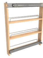
448BSKS3C Sidekick porte-épices