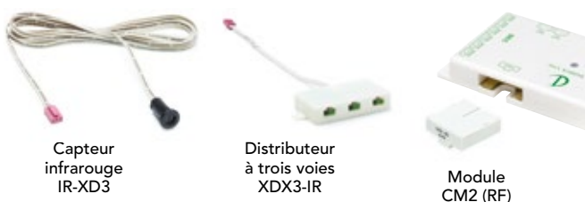
Capteur infrarouge IR-XD3