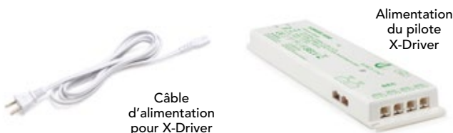
Câble d'alimentation pour X-Driver