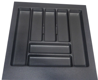
Diviseur à couvert