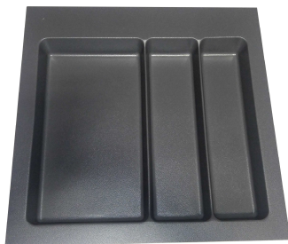
Diviseur à ustensile