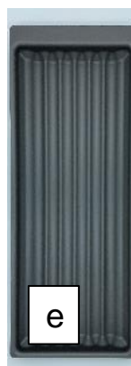
Insert à épices