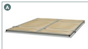
Vertical metal frame 862513GA