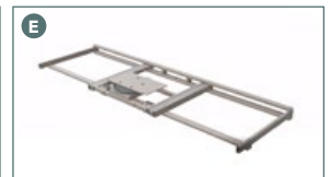
Support inférieur 862513GE