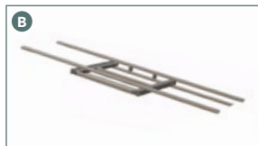
Upper support 862513GB