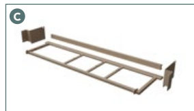
Support d'armoire 862513GC