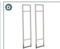
Structure latérale 862513GD