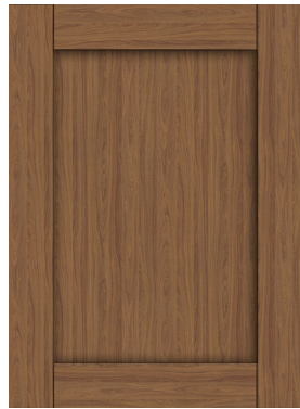
5 pièces 2-1/4"