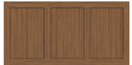
3 - traverses verticales