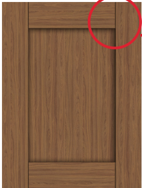
5 pièces 2-3/4"