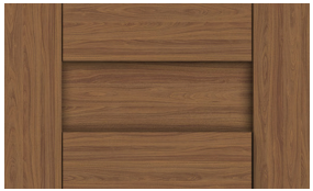
5 pièces 2-3/4"