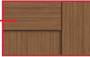
Assemblage 90° Euro Double bande de chant