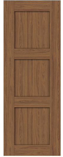
3 - traverses horizontales