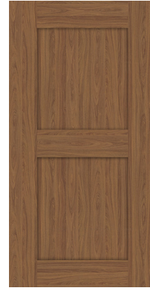
2 - traverses horizontales