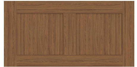
2 - traverses verticales