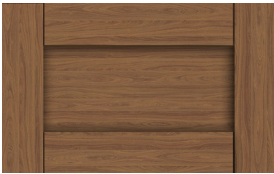
5 pièces 2-1/4"