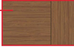
Assemblage 90° Euro Double bande de chant