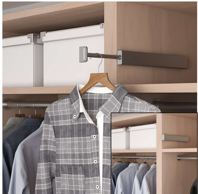
Tringle de valet