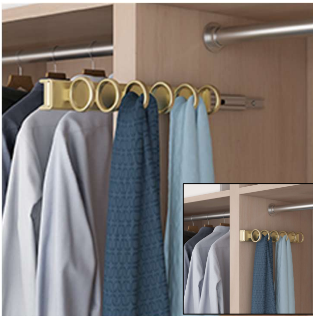
Support à foulards