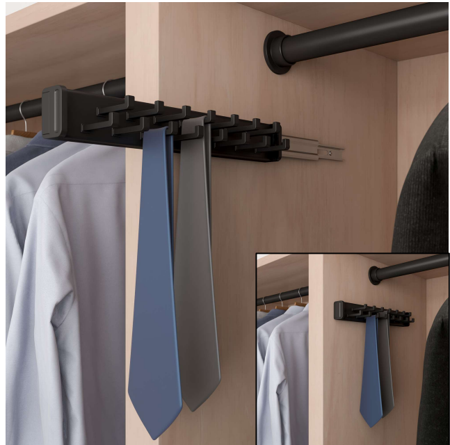
Support à cravates