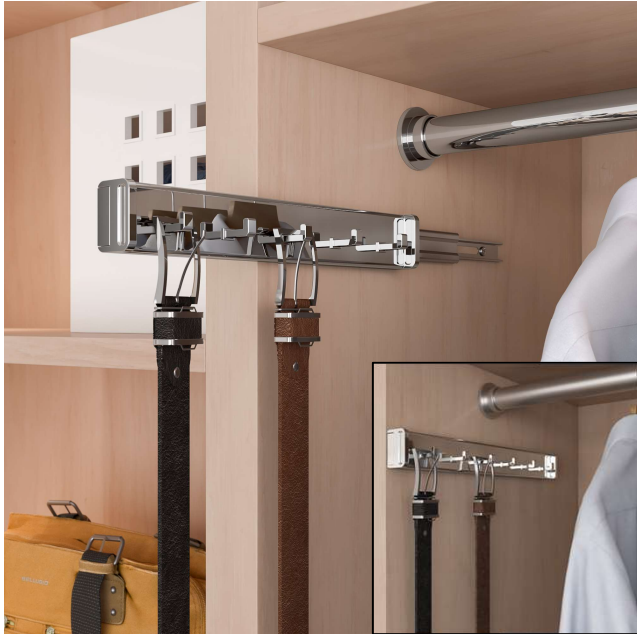
Support à ceintures