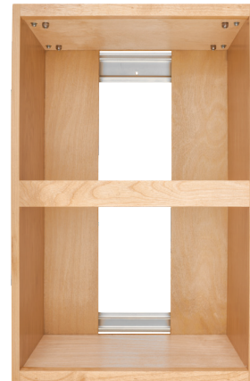
Boîte universelle convient à la fois aux poubelles de 33 et de 47 L.