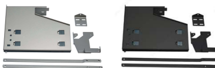
PTO Système d'ouverture automatique mains libres. Une légère pression sur la porte active l'ouverture automatique.