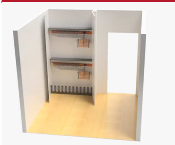
Sur la photo en bas, on voit le support à soulier # 53526100