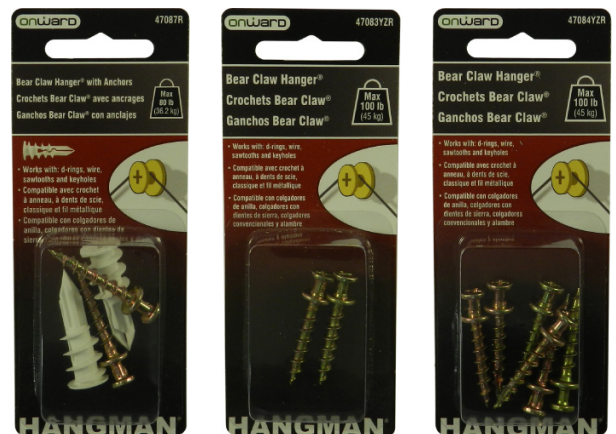
Item # 47085YZR & 47086YZR