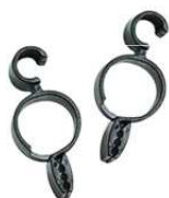
2106011 – pinces pour jupes (sacs de 10)